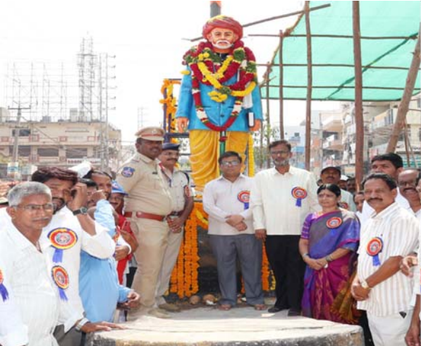
సత్యవార్త, గద్వాల :